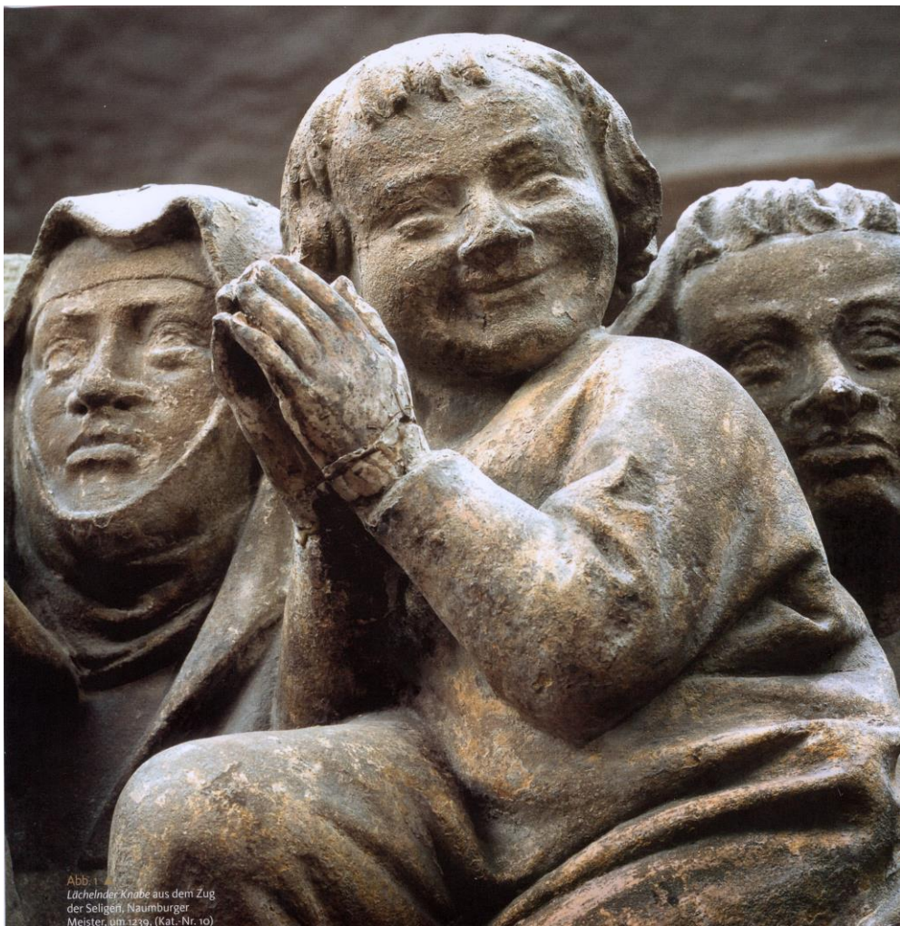
Abb. 1 Lächelnder Knabe aus dem Zug der Seligen, Naumburger Meister, um 1239. (Kat.-Nr. 10)