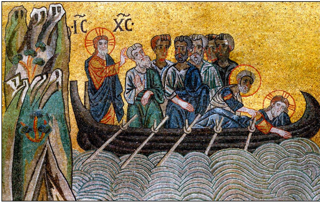
La tempestad calmada Venecia, comienzos siglo XII