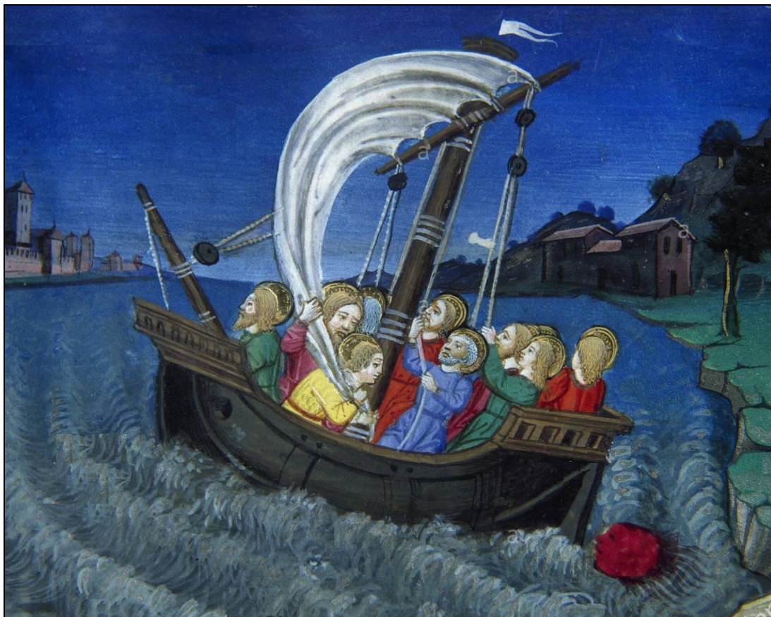
Tempestad en el lago Autor: Cristoforo de Predis, miniaturista del siglo XV 27 enero