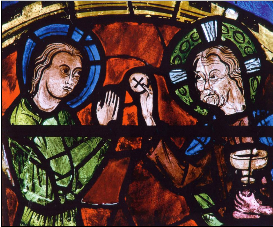
Eucaristía. Vidriera Catedral de Chartres