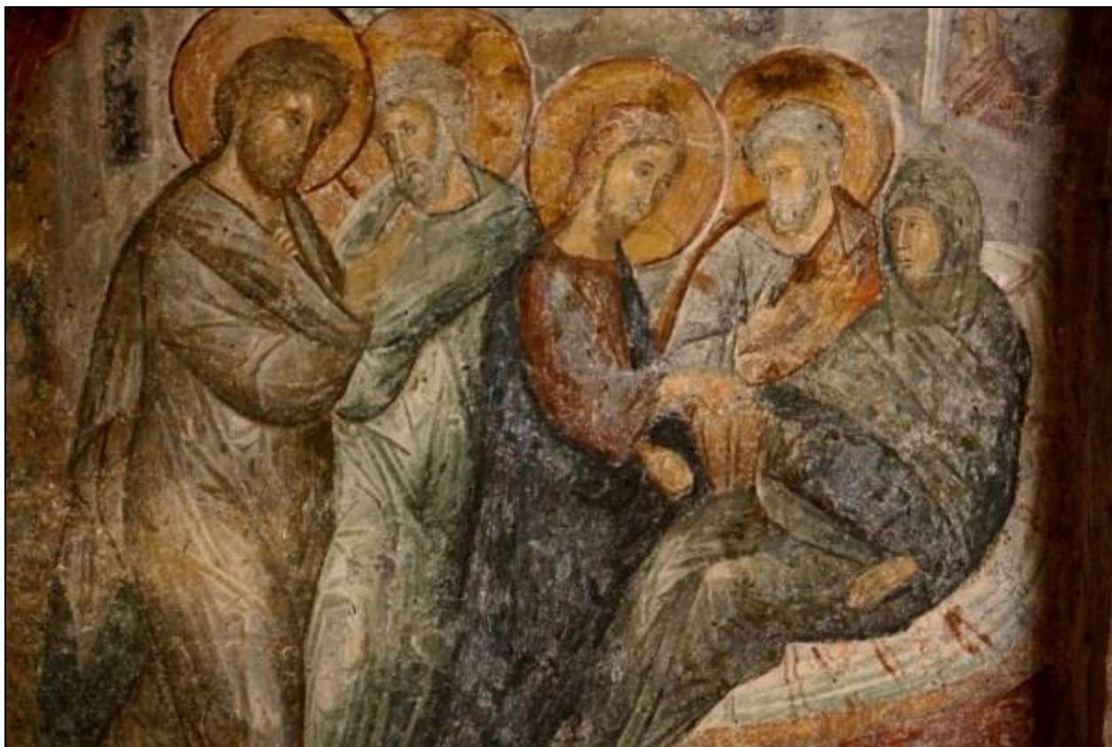
Curación de la suegra de Pedro